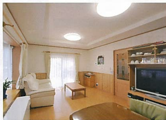
明るく広々としたリビングルーム