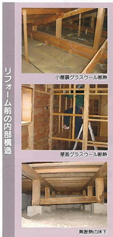
リフォーム前の内部構造

特注ジョイパネル(50mm)で、筋交いの内側に断熱パネル施工。 今までに例の無い、高性能断熱リフォームが可能になりました。