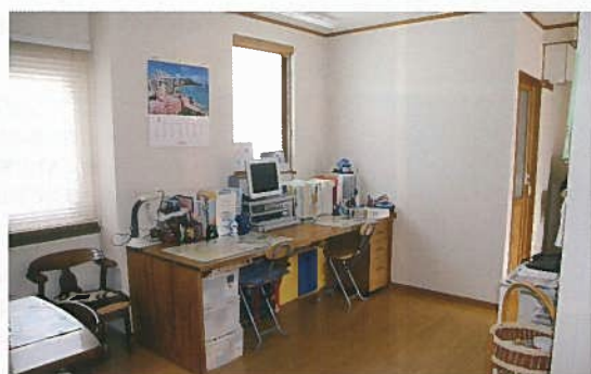
リビングに設けた勉強スペース