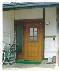
木製高断熱玄関ドア