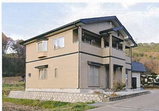
豊かな自然と調和する打田内邸の外観