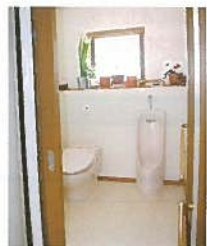
リフォーム後・トイレ