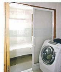
リフォーム後・ユニットバス