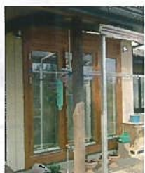
リビング高断熱木製開口部