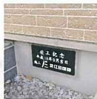
こだわりの竣工記念プレート

でから3年になるけれども、私は一度も風邪をひいたことがありません。昔の住宅と比べたら、雲泥の差です。押しつぶされそうな厚い布団に頼ばかりして寝ていたんですから、今では考えられませんね。娘夫婦、孫達も満足しているようですよ。」とお祖父さま。「暖かいから、つい薄着で外に出してしまいます。」とお祖母さま。残念ながら他のご家族とは会えませんが、とっても幸せそうなおふたりでした。