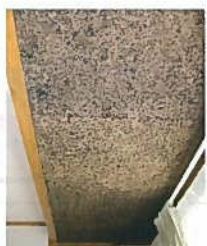
炭化コルクを貼った天井

特注ジョイパネル(50mm)で、筋交いの内側に断熱パネル施工。 今までに例の無い、高性能断熱リフォームが可能になりました。