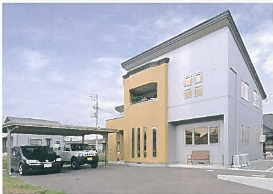
モダンな片流れの大屋根が目を引く外観