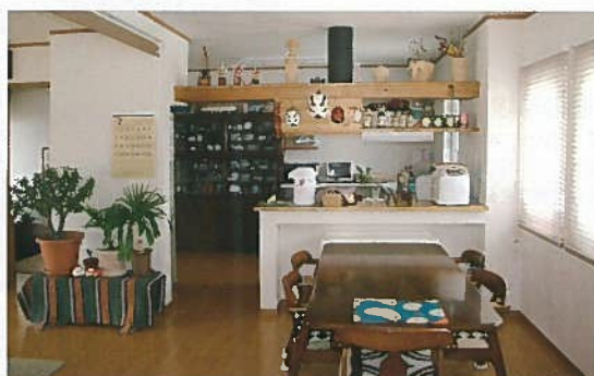
キッチンとダイニング