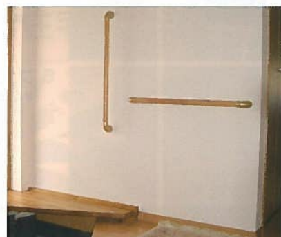
玄関の手すりと腰掛け