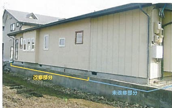
リフォーム外観 (右側一部はリフォーム外)