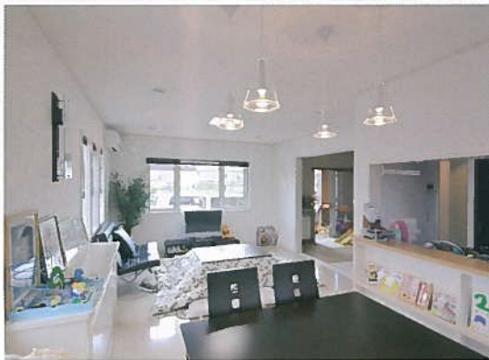
ホホワイトとダークセピアの組合せに施主様のセンスが光るインテリア